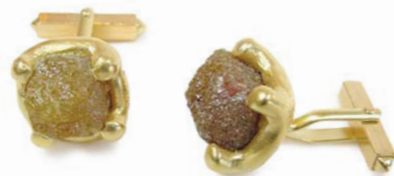
aus der wüste: manschettenknöpfe mit rohdiamanten, 21,95 ct, 750 gold, 2-farbig