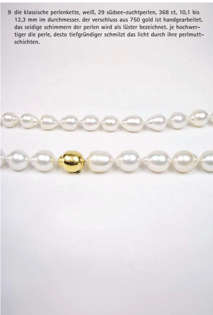
9 die klassische perlenkette, weiß, 29 südsee-zuchtperlen, 368 ct, 10,1 bis 12,3 mm im durchmesser. der verschluss aus 750 gold ist handgearbeitet. das seidige schimmern der perlen wird als lüster bezeichnet. je hochwertiger die perle, desto tiefgründiger schmilzt das licht durch ihre perlmuttschichten.

schicht für schicht hüllt die auster den kleinen fremdkörper in ihrem inneren ein. nach drei jahren aus dem ozean geborgen, gibt sie ihren schatz frei – eine perle. für den züchter bedeutet jedes öffnen einer muschel eine überraschung: keine perle ist der anderen gleich. das wasser in der bucht, im see, licht, kälte oder wärme haben immer aufs neue einfluss auf die ernte. seltene und besondere perlen sind von pazifischen atollen und aus japan nach deidesheim gelangt. was dort aus den „tautropfen des mondes“ entstanden ist, zeigt ihnen die goldschmiede krack gern.