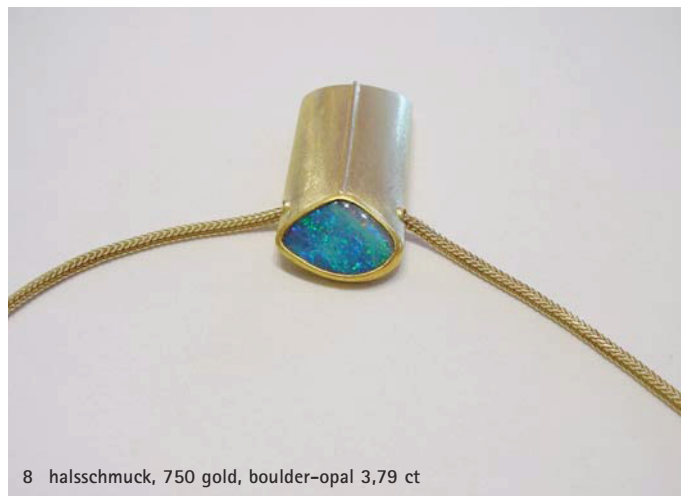
8 halsschmuck, 750 gold, boulder-opal 3,79 ct

* boulder sind geschliffene opale, die auf einer schicht ihres muttergesteins liegen.