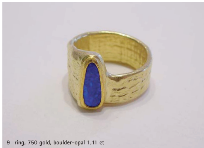
9 ring, 750 gold, boulder-opal 1,11 ct