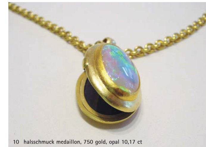
10 halsschmuck medaillon, 750 gold, opal 10,17 ct

natürlich, werden sie sagen. trau- und verlobungsringe gelten als zeichen der verbundenheit. dagegen heute selten und darum außergewöhnlich ist das medaillon. in seinem inneren trug sie gern das bildnis ihres liebsten. die kracks haben solch einen anhänger um einen selten schönen edelopal geschaffen. immer neue lichtfiguren entspringen diesem raren edelstein. ihm ist, wie übrigens allen opalen, der planet venus zugeordnet.