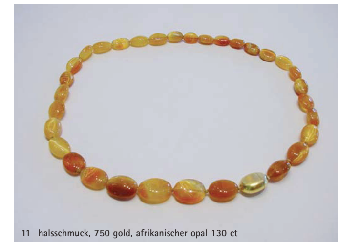
11 halsschmuck, 750 gold, afrikanischer opal 130 ct

opale. ein edelstein mit vielen gesichtern.